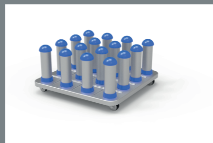
Système porte rouleaux en option